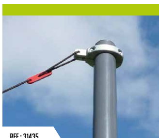
REF : 31435