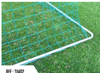
REF : 31402