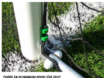
CHAPE EN ALUMINIUM POUR LÈVE FILET