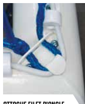
ATTACHE FILET D'ANGLE