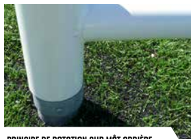
PRINCIPE DE ROTATION SUR MÂT ARRIÈRE