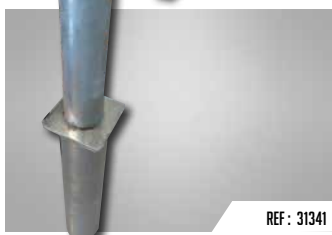
REF : 31341