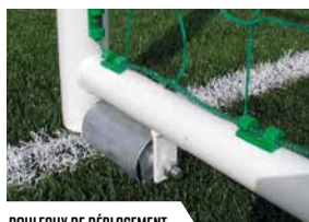
ROULEAUX DE DÉPLACEMENT

*Conforme à la norme NF EN 748 (HORS DIMENSIONS) et au décret n° 1133 DU 24 juillet 2007 Ils répondent aux exigences de la FFF