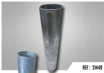
REF : 31449