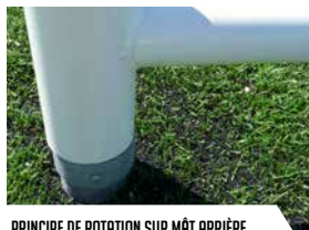
PRINCIPE DE ROTATION SUR MÂT ARRIÈRE