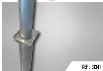
REF : 31341