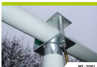
REF : 31361