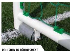
ROULEAUX DE DÉPLACEMENT

*Conforme à la norme NF EN 748 (HORS DIMENSIONS) et au décret n° 1133 DU 24 juillet 2007. Ils répondent aux exigences de la FFF.