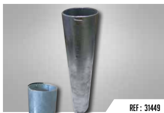
REF : 31449