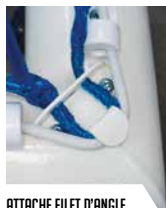
ATTACHE FILET D'ANGLE