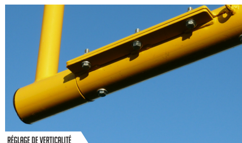
RÉGLAGE DE VERTICALITÉ