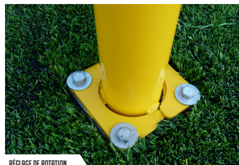
RÉGLAGE DE ROTATION