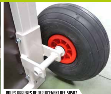
ROUES ARRIÈRES DE DÉPLACEMENT REF. 50507