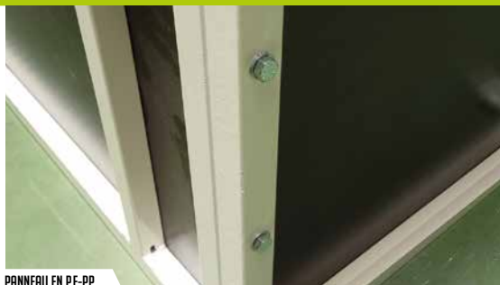
PANNEAU EN PE-PP