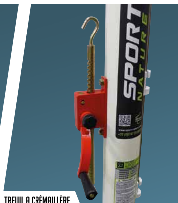
TREUIL A CRÉMAILLÈRE