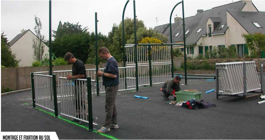
MONTAGE ET FIXATION AU SOL