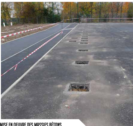
MISE EN OEUVRE DES MASSIFS BÉTONS