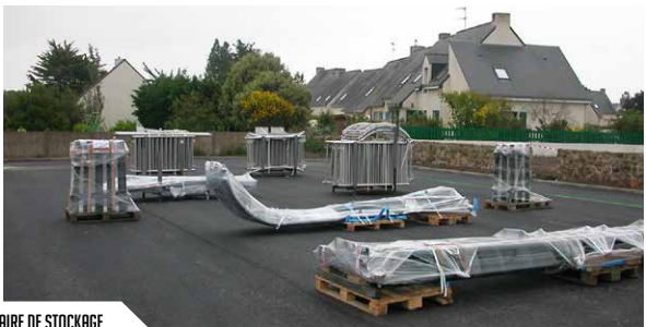
AIRE DE STOCKAGE