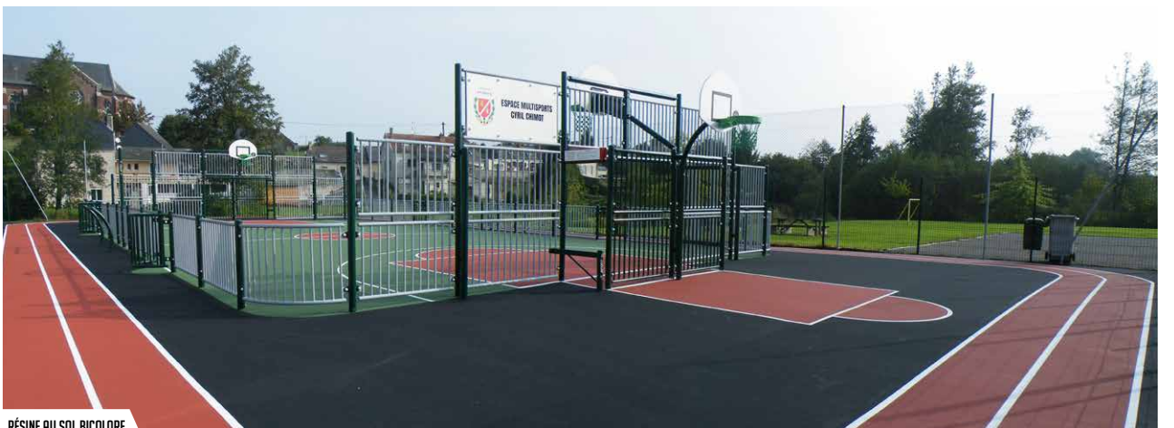
RÉSINE AU SOL BICOLORE

17 RUE DU CHÊNOT - 56380 BEIGNON - FRANCE